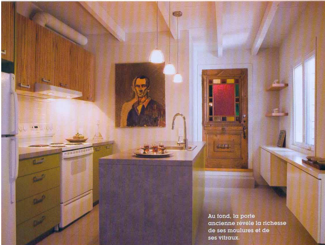
Au fond, la porte ancienne révèle la richesse de ses moulures et de ses vitraux.

Le côté de l'îlot est lui aussi habillé de gris béton; Depuis le salon, on ne perçoit que des couleurs douces.